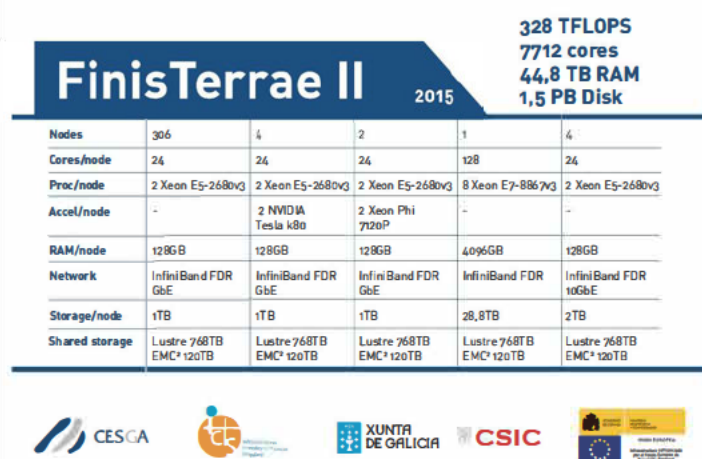
Figura 7.1. Número de cores, memoria de almacenamiento y memoria disponible en el Finis Terrae II.