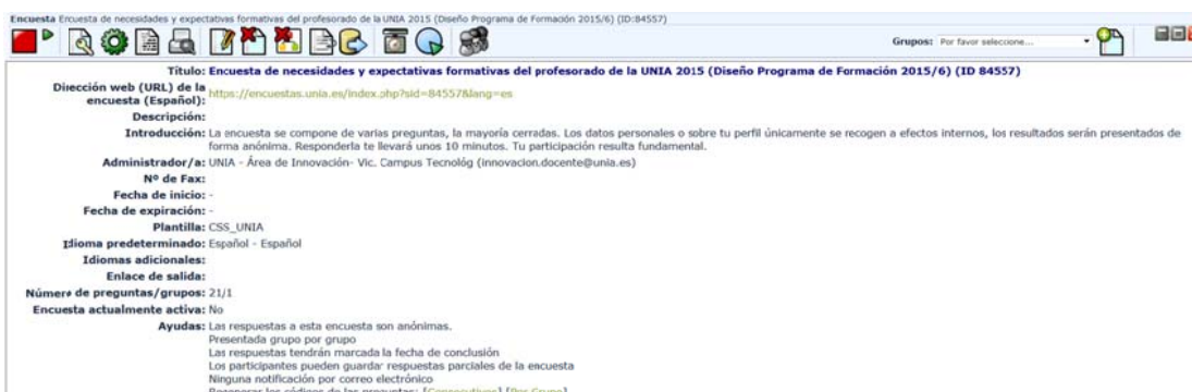
Figura 4. Captura de pantalla de aplicación de encuestas de la UNIA.

Finalmente, el 8 de junio, se suministró invitación a un total de 661 personas 4 , correspondientes a quienes tenían rol de profesor en los cursos de la plataforma de 2014-15 (posgrados y formación permanente), según consulta efectuada en el propio campus virtual de la UNIA.